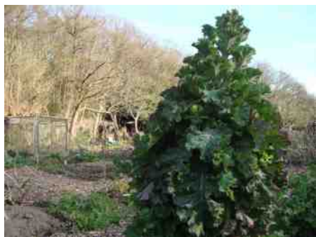
Broccoli Purple sprouting (meerjarig) januari 2015, 1.50 meter hoog

'Sinds 1999 heb ik mijn moestuin maar vanaf 2013 creëer ik mijn eigen paradijs. Het bestaat uit veel drachtplanten voor bijen- ik ben ook imker- en tegelijk ook