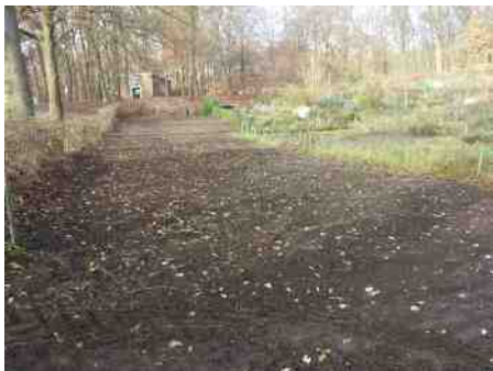
Bosweg begin december 2016