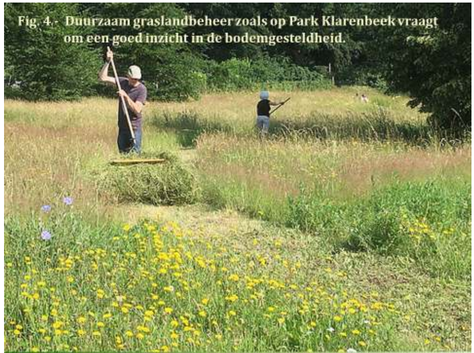
Fig. 4 - Duurzaam graslandbeheer zoals op Park Klarenbeek vraagt om een goed inzicht in de bodemgesteldheid.

Droogtegevoeligheid wordt niet alleen veroorzaakt door verdamping a.g.v. sterke zonnestraling, maar ook door bodemfactoren. De grofzandige stuwwalgronden van onze tuincomplexen hebben van nature een laag vochthoudend vermogen. Toch zijn er aanzienlijke verschillen, want op lage hellingen en in valleien zijn de bodems door afspoeling vaak sterk verrijkt met humeus, fijnzandig en lemig materiaal. Daarnaast krijgen deze gronden plaatselijk extra vocht door opwellend grondwater (kwel). De Arnhemse boeren in de 18de en 19de eeuw wisten dit al en maakten slim gebruik van deze bodemverschillen in het versneden stuwwal-landschap (Fig. 3): op de hoge ruggen lagen de schraalgraslanden begraasd door schapen. Iets lager op de helling verbouwde men