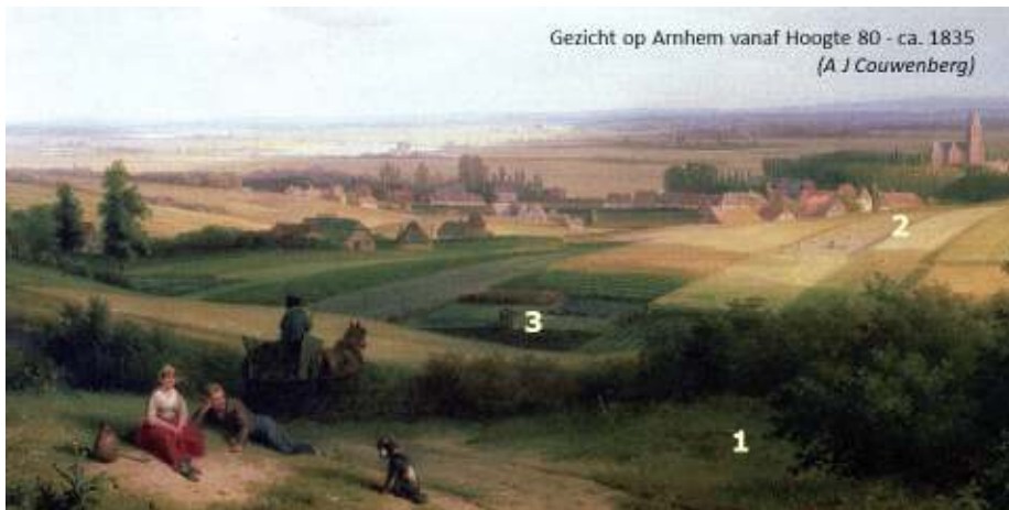
Fig. 3 - De boeren in de 18 de en 19 de eeuw maakten slim gebruik van de ecologische verschillen in het sterkversneden stuwwal-landschap.

Het lijkt dus de moeite waard om hellingen en bodemverschillen op onze complexen wat verder te verkennen en in kaart te brengen. Hierbij zouden bestaande en nieuwe digitale gegevens en veldinfor-