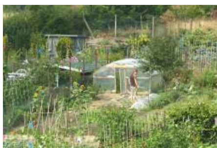
gericht water geven is prima

Sproeien ligt voor de hand. We hebben op onze complexen allemaal een waterleiding en een kraan die goed drinkwater aanlevert. Dat is eigenlijk nogal luxe. Drinkwater, dat we hier op de Veluwe uit de grond halen, wordt steeds schaarser. Het Arnhemse kraanwater komt van La Cabine, een pompstation uit 1909 dat aan de Amsterdamseweg ligt, iets ten noorden van Papendal. Dit opgepompte grondwater is zo'n 1000 jaar 'oud' - het is ooit als regenwater op de Veluwe neergekomen in een tijd dat er nog geen serieuze luchtvervuiling was: lang voor de industriële revolutie, steenkoolstook of vee-industrie. Puur, zacht water waarvan oude Arnhemmers altijd zeiden dat dit "het beste water van Nederland" was.