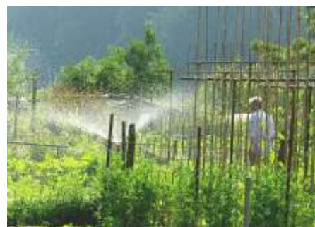
En dit is eigenlijk geen goede manier van sproeien...

In 2018 was de eerste extreem langdurig droge lente/zomer. In dat jaar had ik een aantal opkomende hogere wilde bloemen zoals de teunisbloem en vingerhoedskruid her en der in de tuin laten staan op de groentebedden. Dat was