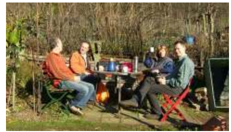
Koffiehoekje in vervlogen tijden

Of een gezamenlijk maaltijd klaarmaken van groeten en fruit uit eigen tuin? De verwachting is dat wanneer jullie dit lezen de 1ste koffieochtend heeft plaats gevonden. En wie het wil kan natuurlijk zelf zoiets organiseren. Misschien heeft iemand nog een leuk idee voor zo'n ochtend.