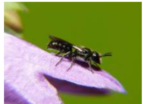
De kleine klokjesbij. De grote klokjesbij lijkt op deze soort maar is -zoals de naam al verkapt- iets groter.