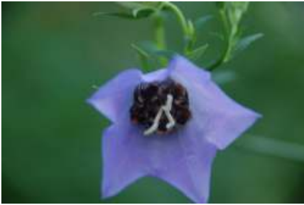
De mannetjes van de klokjesdikpoot slapen in de bloem van een prachtklokje.

resedafamilie en deze bestaat uit twee soorten: wilde reseda en wouw. Zowel wilde reseda als wouw houden van zonnige plaatsen en droge tot vochthoudende open zandige bodems. De resedamaskerbij nestelt in bijenhôtels met kleine gaatjes (3-4 mm) van bijvoorbeeld riet. Wist je dat maskerbijen geen haren hebben om het stuifmeel te vervoeren maar het stuifmeel en nectar in een krop verzamelen en zo naar het nest brengen?