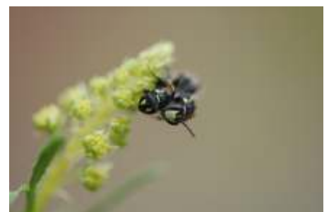
Mannetje en vrouwtje resedamaskerbij. Het masker van het vrouwtje bestaat uit twee witte vlekjes