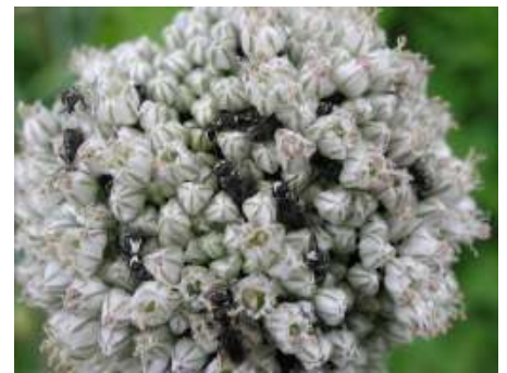
De mannetjes van de lookmaskerbij gebruiken de bloemen ook als slaapplek

De resedamaskerbij is ook een maskerbij en de vorm van het masker verschilt iets van de lookmaskerbij. Deze maskerbijen zijn makkelijk uit elkaar te houden omdat ze hun stuifmeel bij andere planten halen. De resedamaskerbij vliegt namelijk op de