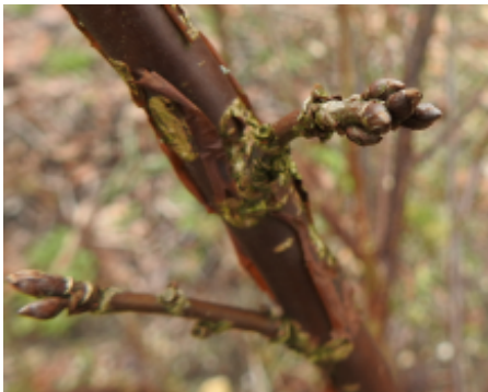
Kortlot met bloemknoppen

Ik heb me voorgenomen om regelmatig te schrijven over het snoeien van fruit. Zowel over bomen op het moment dat dit moet gebeuren, maar ook kleinfruit moet af en toe gesnoeid worden om zoveel mogelijk vruchten te kunnen geven. Dit is deel 3 van een kleine serie.