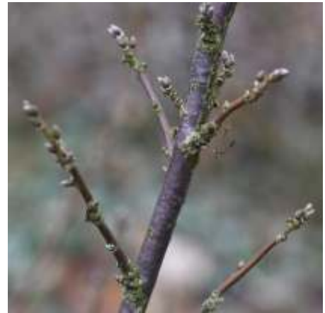
Zwarte bes kortloten

Wil je meer weten over de snoeiprincipes in het algemeen? Ik heb een boek geschreven: "Duurzaam snoeien met respect voor plant en dier". Je kan het bestellen door mij te mailen. De kosten bedragen 29,99.