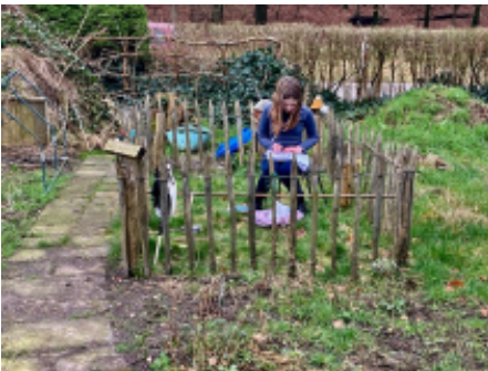
Dat je op de volkstuin ook in de winter heel goed huiswerk kunt maken, bewijst deze foto!

In de eerste tien dagen van oktober was het nog rustig, vrij warm en meestal droog herfstweer. Daarna begon een lange, zeer natte periode, die met een kort en licht winters intermezzo eind november, voortduurde tot eind december. In een tijdsbestek van tweeëneenhalve maand viel de helft van de normale jaarneerslag. November was uitzonderlijk nat en zacht, maar eindigde koud. December begon koud, met op 1 december zelfs een ijsdag en de laagste maximumtemperatuur van het jaar: -0,4° C. Maar al snel werd het zacht en soms zelfs zeer zacht. Met 181 mm werd december de natste maand van dit jaar.