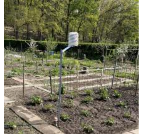
Een foto van het weerstation op de volkstuin.

Het jaar 2023 gaat de klimaatboeken in als het natste en warmste jaar ooit gemeten. Landelijk was 2023 met gemiddeld 11,8 °C een fractie warmer dan de vorige recordhouders: 2014 en 2020. In Arnhem viel ongeveer 1250 millimeter regen, normaal is 934 millimeter. Daarmee was het in deze regio natter dan in 1998 en 1966 en het natste jaar ooit gemeten. Ondanks het overschot aan regen was het ook een zonnig jaar, met ongeveer 1800 zonuren.