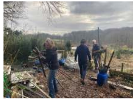
De foto's op deze pagina doen verslag van twee schoonmaakacties op de Parkweg.

Voor 2024 gaan we weer voor een wedstrijd: wie heeft de grootste diversiteit aan planten/ groente/fruit op zijn/haar tuin gehad? Graag ondersteunen in oktober met een aantal foto's (3), genomen tijdens het tuinseizoen. De hoogste zonnebloem en grootste pompoen (gekweekt zonder kunstmest) dingen ook mee in de wedstrijd